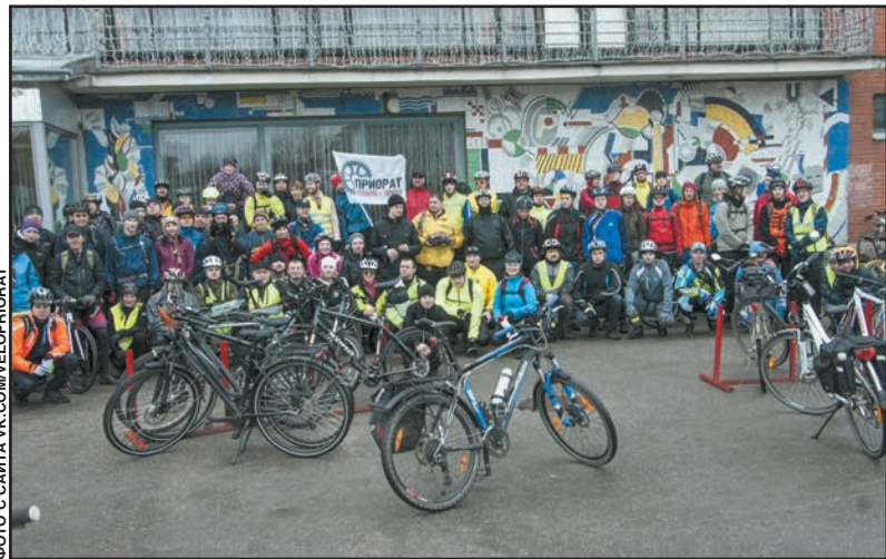
ФОТО С САЙТА VK.COM/VELOPRIORAT

МИРА ХРИТОНЕНКО С ИСПОЛЬЗОВАНИЕМ ИНФОРМАЦИИ ПРЕСС-СЛУЖБЫ ОКО «БОКО-БКС» И VK.COM/VELOPRIORAT