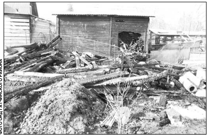
ФОТО ОНД ГАТЧИНСКОГО РАЙОНА

5 апреля в деревне Березнёво выгорела блочная застройка для содержания животных вместе с животны-