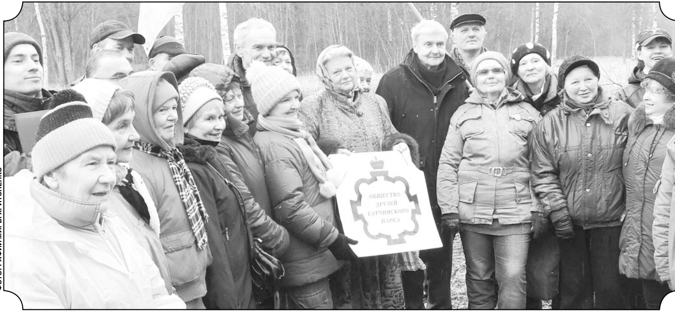
ФОТОГРАФИИ МИРЫ ХРИТОНЕНКО

Рассказы о себе и своих увлечениях присылайте в редакцию по адресу: Гатчина, пр. 25-го Октября, д. 33/1; gtik@oreol.info